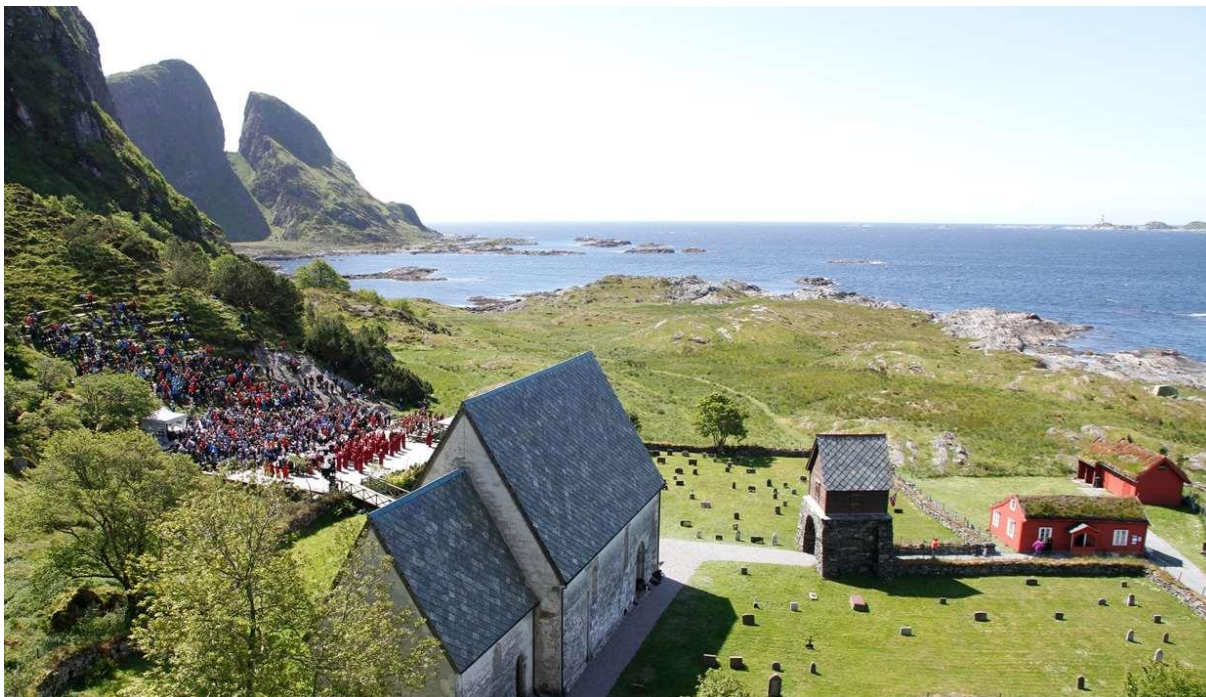
Frå Kinnaspelet.

Bakkejekta seglar til Kinn og er på plass seinast etter gudstenesta. Bakkejekta og båten frå Kalvåg kystlag legg til på flytebryggje i Kinnavågen litt nordaust for Kinnakyrkja. Høvedsmann Bakkejekta: Rich Lennox. Distanse Jensbua-Kinn: 24 nautiske mil.