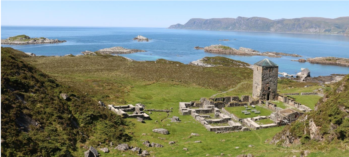
Selja kloster.