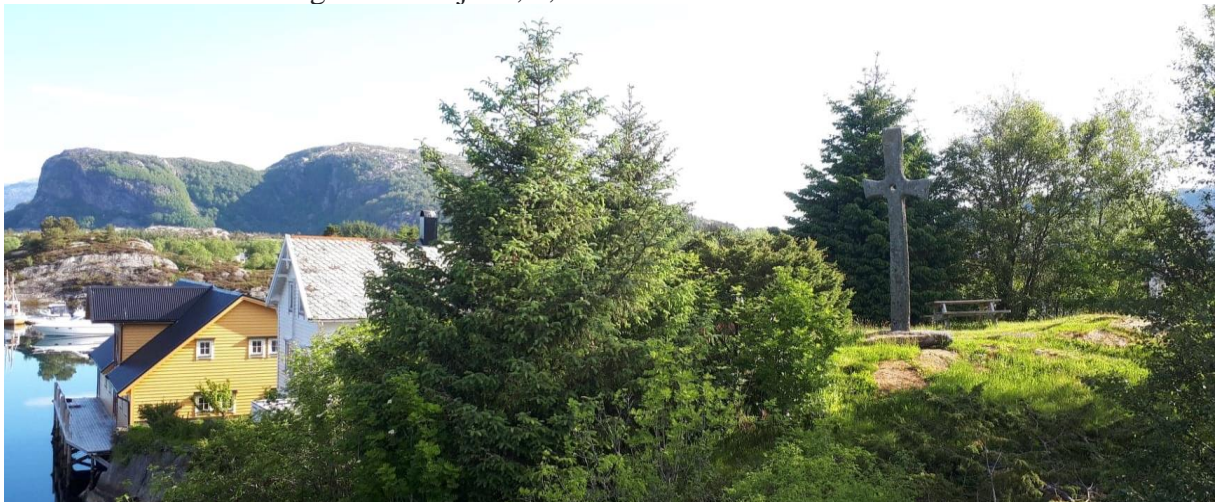
Korssund med krossen til høgre.

Bakkejekta seglar vidare sørover med skrinet og passerer gjennom Lammetusundet og Korssund. Kort stogg i Korssund. Skrinet opp til Olavskrossen (for øvrig produsert i Hyllestad) for enkel lesning ved ungdomspilegrimane og påfyll av brev frå elevar frå Våge skule. Her vert óg steinkrossen frå Hyllestad overlevert ved representantar frå Hyllestad. Distanse Askvoll-Korssund: ca. 7 nautiske mil. FN-sambandet si undervisning i Korssund: involvera Våge skule i Fjaler, 4,5 km frå Korssund.