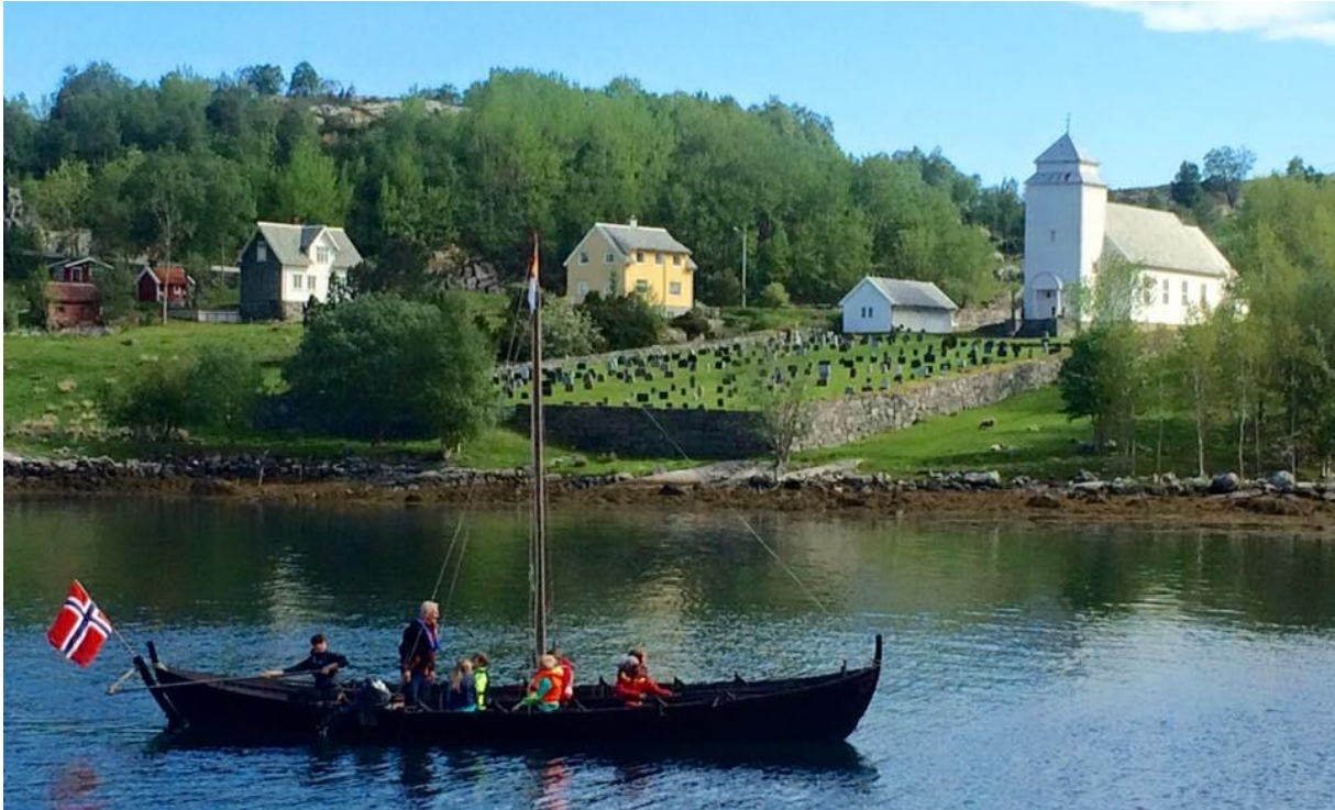
Sekskeipingen Knut.

Ca. klokka 1800: Båtveksling ved Hornelsneset. Ungdomspilegrimar og skrin over i båt frå Hornelen kystlag (for å halda tidsskjemaet bør det truleg til noko sleping ved KMØ-seglbåt utover Frøysjøen?).