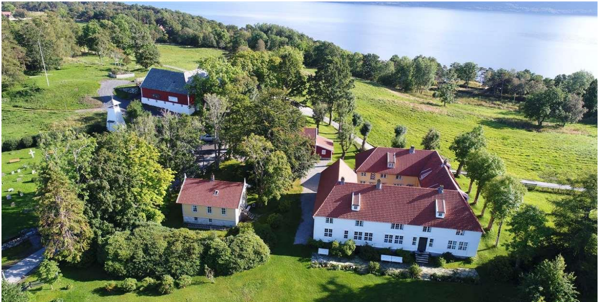
Svanøy Hovedgard med Olavskrossen på kyrkjegarden til venstre i biletet.

Tidleg avgang: skrin og ungdommar går om bord i Bakkejekta og seglar til Svanøy. Distanse Kinn-Svanøybukt på Svanøy: ca. 12 nautiske mil.