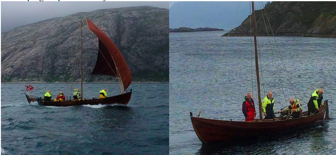
Kystkulturlaget i Vågsøy sin femkeiping Hopland.

Klokka 1030: ankomst/velkomst ved ordførar og prest av Kystkulturlaget frå Vågsøy sin femkeiping Hopland til Selja.