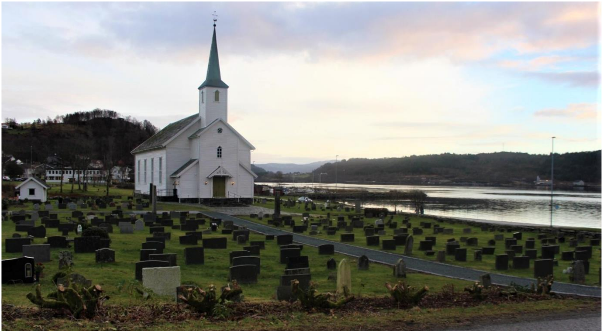
Askvoll kyrkje med båthamna i bakgrunnen til høgre.

Dagtid: Undervisning/strandrydding på Svanøy. Involverte aktørar: FN-sambandet, Flora ungdomsskule, Svanøy Folkeakademi og KMØ-seglbåt. Når Bakkejekta kjem skal skrinet opp til steinkrossen ved Svanøy hovudgard, enkel lesning ved ungdomspilegrimane, Flora-elevane legg sine brev i skrinet. Etterpå prosesjon ned til båten, skrin og ungdomspilegrimar går om bord i Bakkejekta og seglar til Askvoll. Distanse Svanøy-Askvoll: ca. 14 nautiske mil. KMØ-seglbåt fraktar FN-personell frå Svanøy til Flokenes der bilen deira ventar.