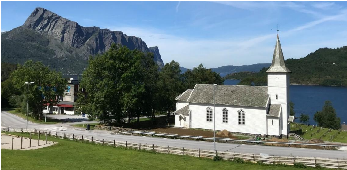
Hyllestad kyrkje med fjorden i bakgrunnen.