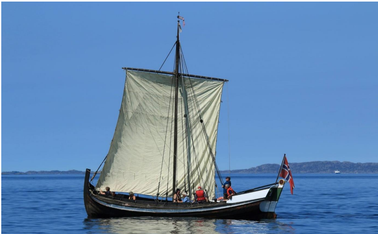
Den Gode Hensigt.

Kl. 1830: prestaskøyto møter Den Gode Hensigt på fjorden nord for Kilstraumen i Austrheim. Felles ankomst ca. kl. 1900 ved Kilstraumen brygge. På land vert det kombinert gudsteneste og kulturarrangementet med litt om ferda, innlegging av brev, saga om prestaskøyta og musikalske innslag. Ansvarleg: Rune Minde. Skrinet overnattar i rommet på Prestaskøyta. KMØ-seglbåt dreg sørover på kvelden.