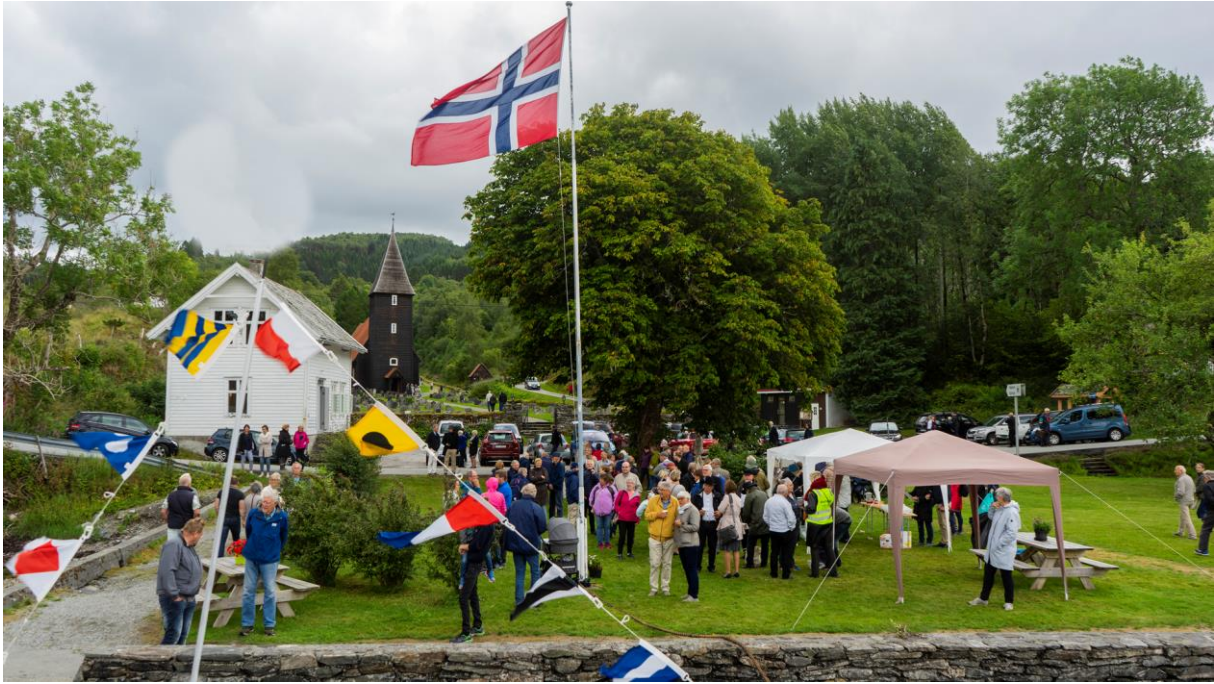
Hamre kyrkje på Osterøy.